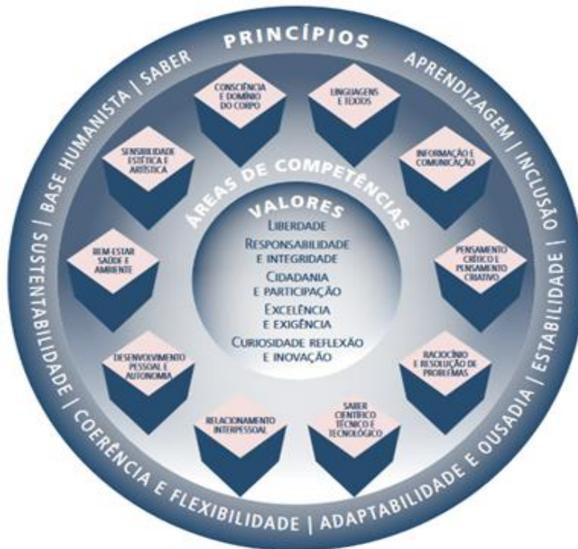
Figura 1 - Esquema concetual do Perfil dos Alunos à Saída da Escolaridade Obrigatória

A abordagem destes domínios deverá privilegiar o contributo de cada um deles para o desenvolvimento dos princípios, dos valores e das áreas de competências do Perfil do Aluno à saída da Escolaridade Obrigatória (figura 1).